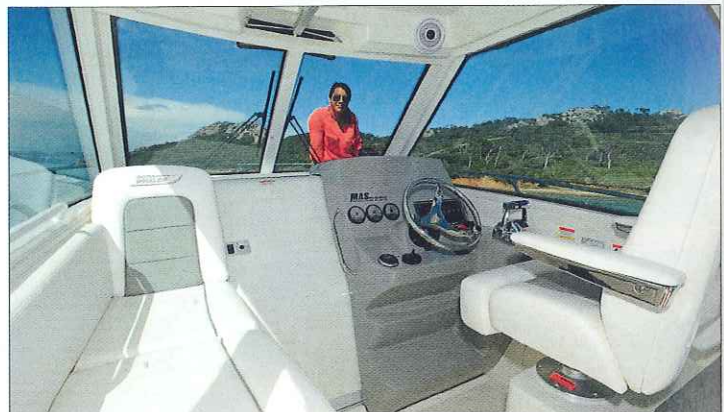
Siège Pullman et méridienne se côtoient sous la timonerie, illustration de la double destination du 285 Conquest : pêche et loisirs.