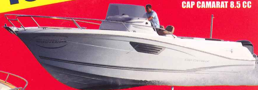
JEANNEAU CAP CAMARAT 8.5 CC