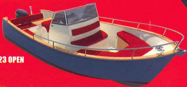
RHEA 23 OPEN